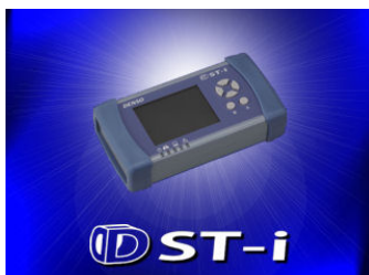
DST-iの初期画面で「A」ボタンを押します

DST-i本体電源を起動し、以下の画面上にて現在ご使用のソフトのバージョンが確認できます。